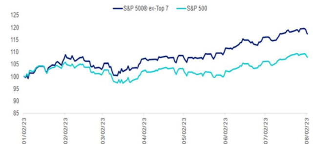
S&P500 Performance Comparison

根据右图, 标准普尔 500 指数中的七家大型成长型公司 (Alphabet, 亚马逊, 苹果, Meta, 微软, 英伟达和特斯拉) 具有多种因素, 使它们成为有吸引力的投资目标, 特别是在市场回调和经济衰退时期。这些公司为标准普尔 500 指数 2023 年的总回报做出了重大贡献, 年初至今的回报率中 74% 来自它们。